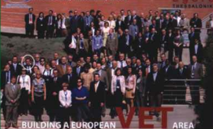
EU Annual Round Table, Thessaloniki, Greece