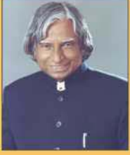
ಡಾ. ಎಪಿಜಿ ಅಬ್ದುಲ್ ಕಲಾಮ್ ಭಾರತದ ಮಾಜಿ ರಾಷ್ಟ್ರಪತಿಗಳು

ಭಾರತದ ಪರಿವರ್ತನೆಗಾಗಿ ಇಲ್ಲಿಯ ನಾಗರಿಕರ ಚಳುವಳಿಯಾಗಿ “i Watch” ನಿರ್ಮಾಣವಾಗಿದೆಯೆಂದು ತಿಳಿದು ಅತೀವ ಸಂತೋಷವಾಯಿತು.