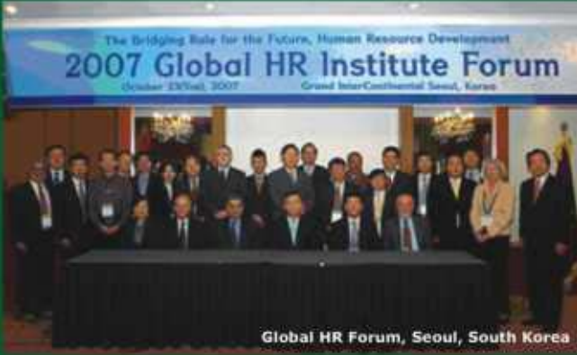
Global HR Forum, Seoul, South Korea