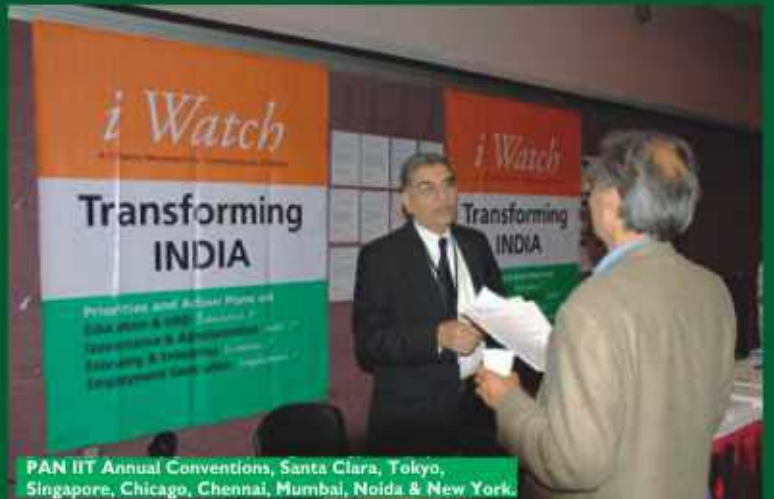
PAN IIT Annual Conventions, Santa Clara, Tokyo, Singapore, Chicago, Chennai, Mumbai, Noida & New York.