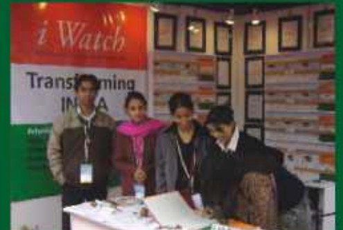
Pravasi Bhartiya Divas, New Delhi, India